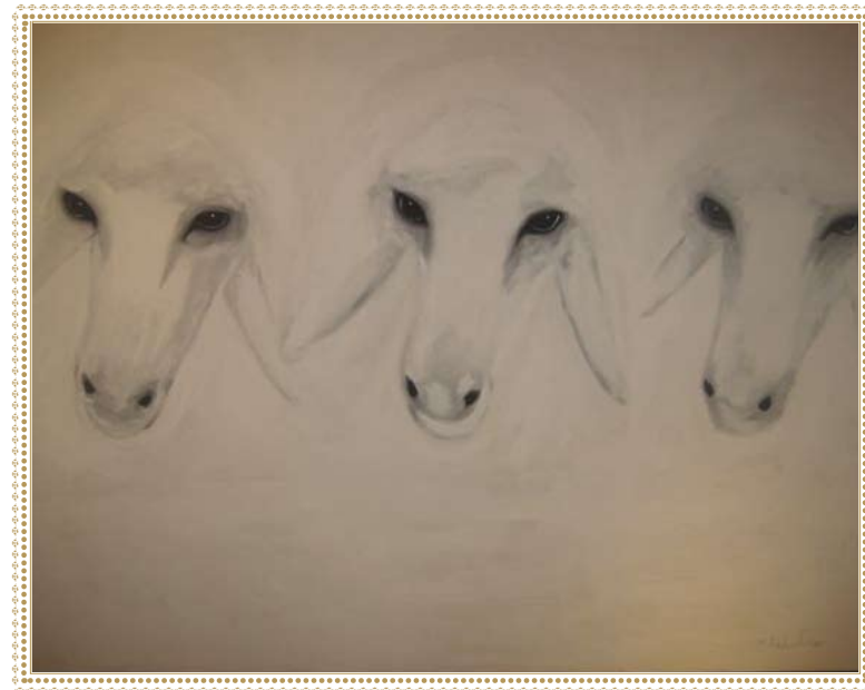
ראשי כבשים מונשה קדישמן