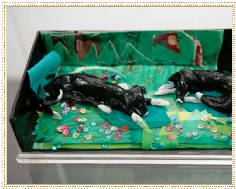
ללא כותרת מיכל ארז

בנוכחותה הפרמקונית 1 , המוראנית 2 והאקס-טימית 3 , האמנות גם מבטיחה לנו בית. זהו בית מוזר, כי הוא אינו בית אליו שבים מהגלות, אלא בית השוכן בלב לבה של הגלות, השוכנת בבית. האמנות היא הבית השוכן בגלות שבביתנו פנימה. האם בכוחה של האמנות לשכננו מחדש בינות להריסות האוטופיה הציונית, ולנסות ולהגשים שוב את הבטחתה? האם בכוחה להפוך שוב לבית את הבית שהפך לגלות? האם בכוחה להשיבנו הביתה מהגלות שבביתנו?