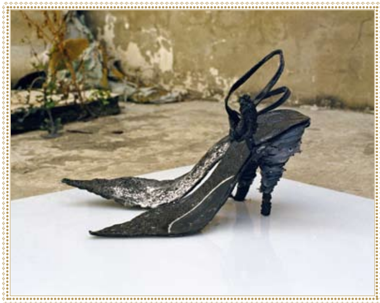
נעלי עקב שי-לי עזויאל